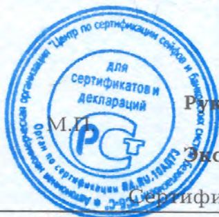
Схема сертификации - 1с